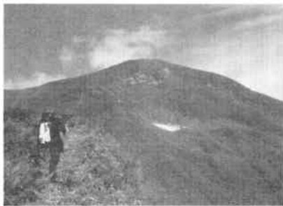
中峰上部の薮刈り状況：小国山岳会 金野氏撮影

託して、H23年8月のお盆明けから約1週間荒廃した登山道の道刈りを実施しております。道刈りをしたのは主に薮化の進んだ中峰〜北股岳の山頂になります。そのほかに、支障木の撤去、水場《中峰》の整備、標識等の修繕も行っております。薮刈り直後に、