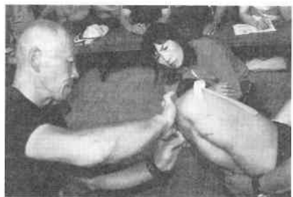
テーピングの指導

また2万5千分図は細かくて読みにくい場合は拡大コピーをして持って行く。そして拡大コピーを使い出したらいつもそれを使うようにし距離感のずれをなくする。拡大コピーは常に一定の拡大率にした方が良いのだろう。 緊急時の連絡方法として現在圧倒的に携帯電話が使われるが、これについても行動中